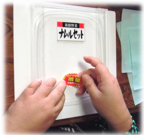
容器の蓋に2種類のシールを貼るメンバー。 「曲がらないように、慎重に」っと

これからも、様々なお仕事が戴けるように、一つ一つの作業を丁寧に行う事を心掛けていきます。